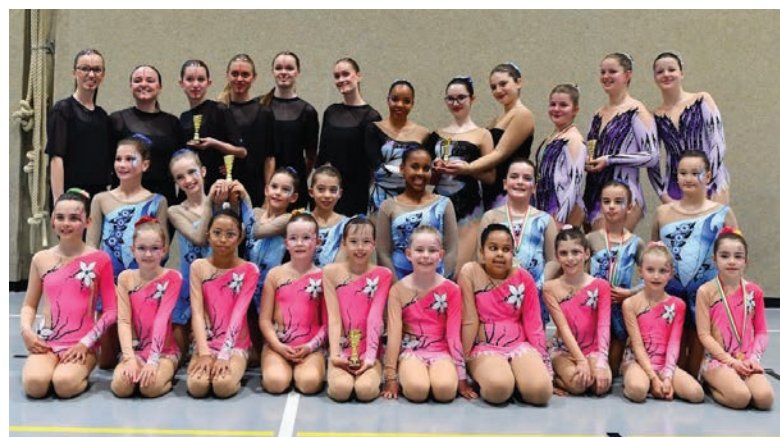
Bravo à toutes ces championnes