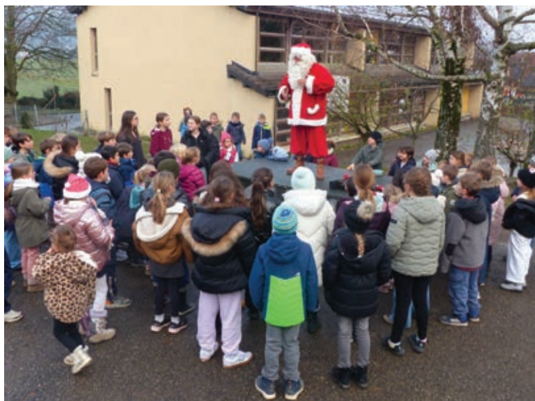
Pas facile d'apprendre ces pas de danse...