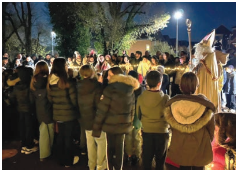
Saint Nicolas sait apprécier la bonne chanson.