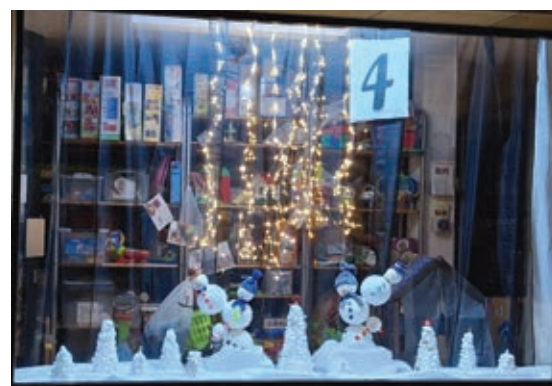
... ou encore à la Fleur-de-Lys. Saurez-vous découvrir les autres?