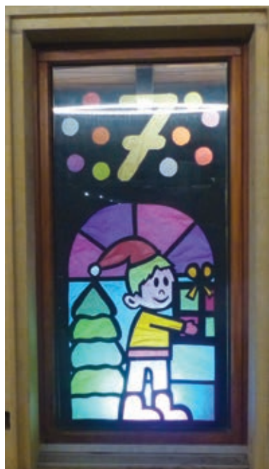
Au P'tit four ...

Tel un calendrier de l'Avent géant et comme il est maintenant de coutume dans beaucoup de localités du bas du canton, dès le 1 er décembre, des fenêtres s'illuminent, quelque part dans nos communes, pour nous faire patienter jusqu'à Noël. Les premières heures de la nuit de ce début décembre nous montrent déjà de petites merveilles qu'il faut découvrir en arpentant les rues de nos villages par exemple à la rue du Closel, à la rue de la Fleur-de-Lys (Ludotène) ou au P'tit Four à Wavre.