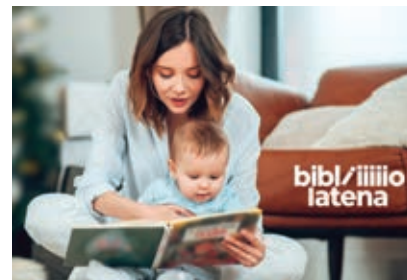
Votre bibliothèque de Laténa

Stoppa Fils SA PLÂTRERIE - PEINTURE NEUCHÂTEL • MARIN