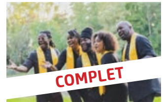
Café-Théâtre de la Tour de Rive - Sparkle Family - Gospel Samedi 13 décembre 2025 à 20h00